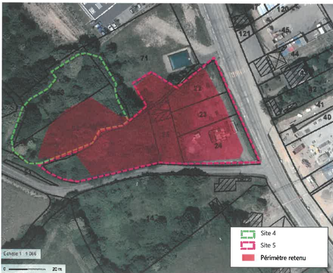
Carte 23: délimitation du périmètre de la mesure compensatoire